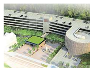
Parkovací dům ve Velké Úpě letos nevyznikne. 2x vizualizace: Atip

Přednost dostane kapacitně větší projekt dopravního terminálu v Peci se čtyřpatrovým parkovacím domem pro 450 vozidel. Vyrostě blízko čerpací stanice a stane se hlavním dopravním uzlem horské oblasti. To do tohoto místa přestěhuje autobusové nádraží. Budou sem jezdit autobusy nejen veřejné dopravy pro obyvatele Pece a přilehlých oblastí, ale také turistů a zaměstnanců. Stavět tu budou rovněž skibusy a budoucí vnitřní městské spoje.