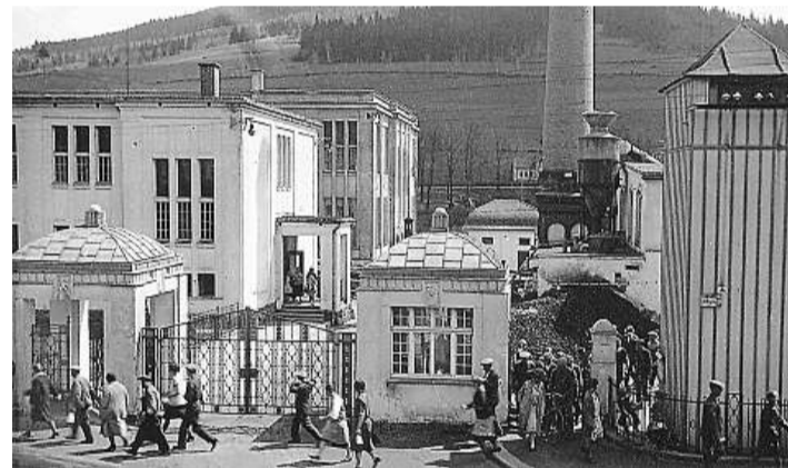
Odchod ze směny Archivní fotografie z první republiky zachycuje odchod pracovníků továrny ze směny.

Detoa se v současné době vyvážejí hlavně do Japonska. Detoa asi tři pětiny své produkce vyveze, zbytek zůstane v tuzemsku. „Hodně zboží od nás bere velká německá firma Ravensburger,“ podotýká Zeman.