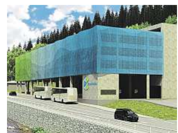
Dopravní terminál je pro Pec prioritou. Součástí bude i parkovací dům.

Dřívější zahájení výstavby dopravního terminálu u čerpací stanice před parkovacím domem ve Velké Úpě bude pro hlavní středisko východních Krkonoš smysluplnější. Už na jaře totiž začne nad Portáškami u horní stanice lanovky vznikat Herní krajina Pecka za 45 milionů korun. Naučná stezka s 20 stanovišti pro rodiny s dětmi, která částečně povede i nad zemí, se bude otevírat už v létě. Pokud by se dole ve Velké Úpě zároveň stavěl parkovací dům, turisté by neměli kde zaparkovat.