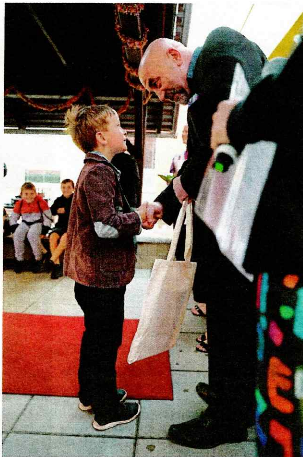
VÍTÁNÍ PRVNÁČKŮ MEZI TRADIČNÍ AKCE PATŘÍ VÍTÁNÍ PRVNÁČKŮ.