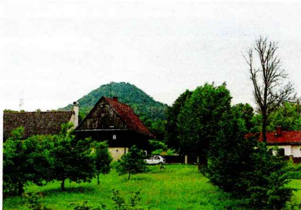
RONOV I VÍSECKÁ RYCHTA NAD KRAVAŘEMI SE VYPÍNÁ Z DÁLKY DOBRĚ PATRNÁ STRMÁ HORA RONOV. DOLE ROUBENÁ VÍSECKÁ RYCHTA.